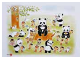
パンダとなかよしこけし