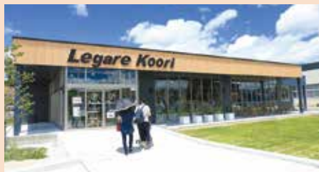
桑折町振興公社が運営するレストラン「Legare Koori」